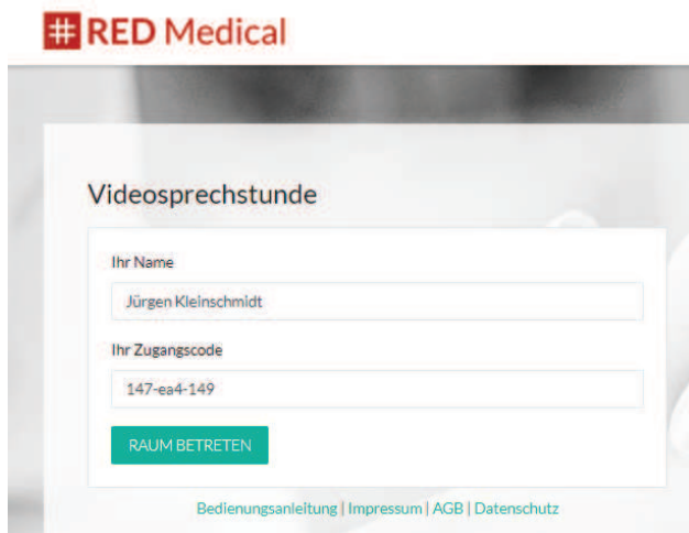
Abbildung zu Punkt 3 und 4: Name und Zugangscode eingetragen